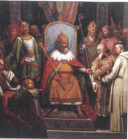
Plongée dans le monde agité et complexe du haut Moyen Age. Ici, Charlemagne reçoit Alcuin, en 781, par Jules Laure (1837).