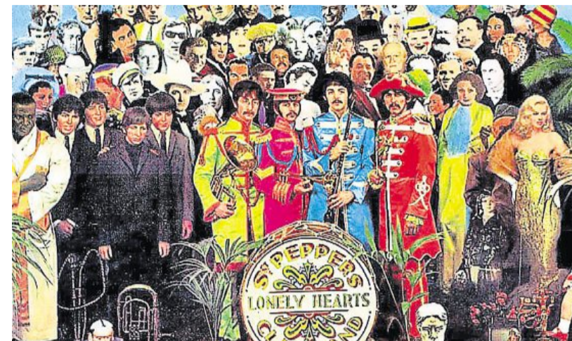
« Sgt. Pepper » est parfois présenté comme le meilleur disque de tous les temps.

Cinquante ans après sa sortie, l'album « Sgt. Pepper's Lonely Hearts Club Band » reste un tournant majeur pour la musique pop mais aussi pour la carrière des Beatles, décidés à explorer de nouveaux horizons au risque de désorienter leur public. Sorti le 26 mai 1967 au Royaume-Uni et le 2 juin aux États-Unis, le huitième album studio du groupe de Liverpool est souvent considéré comme le premier album pop concept (thématique), même si la musique classique et le jazz pourraient revendiquer la paternité du genre. Il est aussi parfois présenté comme le meilleur disque de tous les temps, notamment par le magazine américain de référence Rolling Stone.