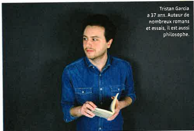
Tristan Garcia a 37 ans. Auteur de nombreux romans et essais, il est aussi philosophe.