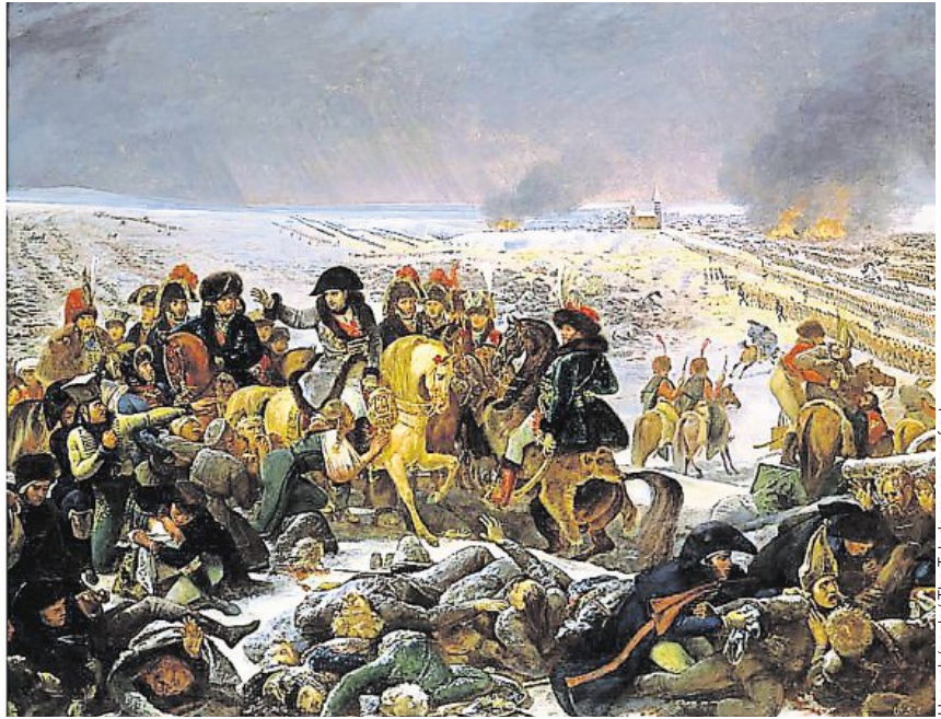
Hannah/Opale/The Toledo museum of art