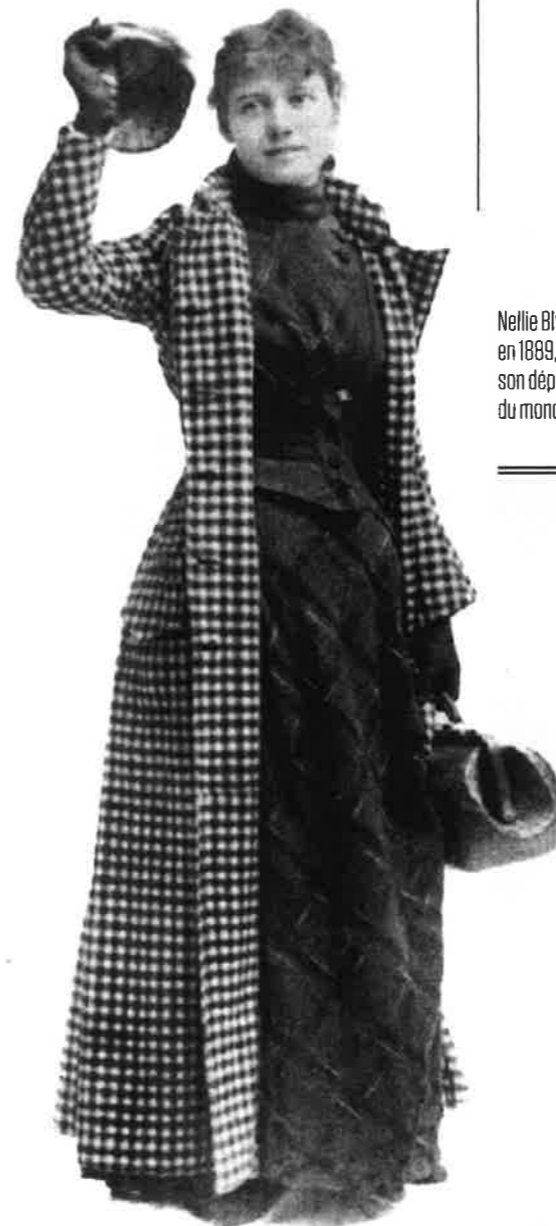
Nellie Bly à New York en 1889, juste avant son départ pour un tour du monde.