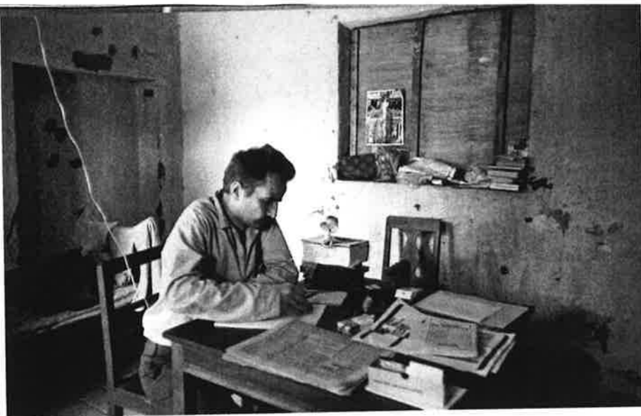
Régis Debray, en prison à Camiri, en Bolivie, en 1966. Engagé aux côtés du Che, il a été arrêté par la police bolivienne et condamné à trente ans de travaux forcés. Le 23 décembre 1970, il sera libéré et expulsé.

➔ comme « Vichy's French ». Sans doute aurait-il mieux fait de ne pas applaudir Mussolini, qu'il voyait comme un rempart contre Hitler du temps où il couvrait la conquête italienne de l'Éthiopie pour « Paris-Soir ». Désormais âgé de 63 ans, l'étrange écrivain-commerçant qui fascinait tant Kessel est gardé par des Djambos, qu'il présente comme des « Noirs souahélis, brutes intégrales dressées à brutaliser le Blanc ». Il souffre d'une chaleur épouvantable, adresse des lettres passionnées à la femme de sa vie, tue le temps en noircissant des pages d'une petite écriture serrée. Son carnet de déportation vient d'être retrouvé et publié. C'est le témoignage douloureux d'un homme qui a toujours eu la liberté dans le sang, et se retrouve à « peindre des vues de forêt à travers les barbelés » : « J'assiste à l'agonie de ma personnalité », note-t-il avant de dire son « dégoût de l'homme, cet animal infernal, nuisible à lui-même ». Mais on ne brise pas comme ça un type qui a fait ses débuts dans une laiterie normande. Libéré au printemps 1943, Monfreid s'installe au pied du mont Kenya : il y passera quatre ans à fabriquer des camemberts, pour les fourguer aux Européens du secteur.